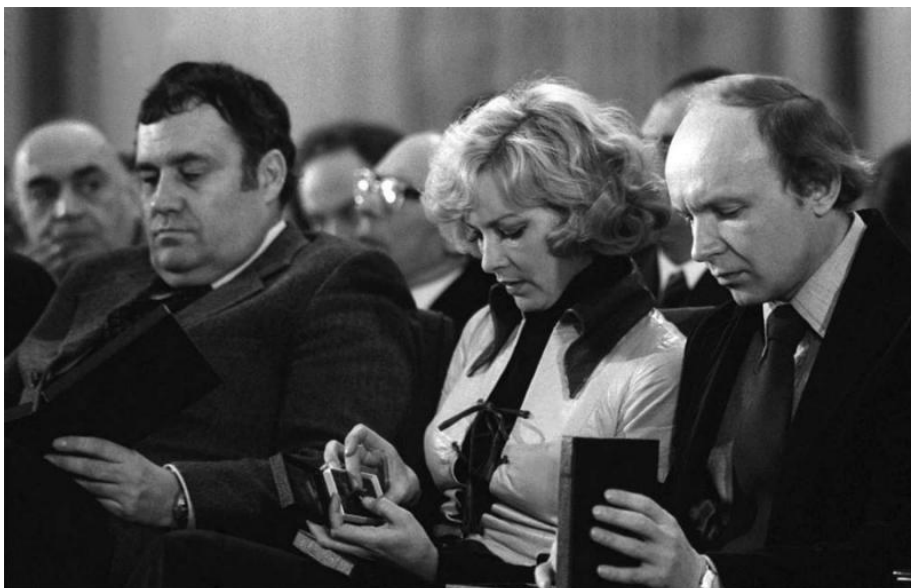
Эльдар Рязанов, Барбара Брыльска, и Андрей Мягков на вручении Государственных премий за фильм "Ирония судьбы или с легким паром".

1996 - Приз "за лучшую женскую роль иностранной актрисы в русском фильме о любви" Б. Брыльска на МКФ «Лики любви» в Москве;